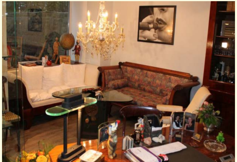
»Premium Cigars & Antiques, Bochum